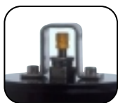
Tappo di protezione e Valvola carico gas Costruita in Acc. Inox