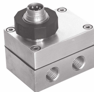
Versione per pressioni basse

L'uscita analogica è graduabile liberamente tramite l'interfaccia. Per le misurazioni dei flussi è possibile anche produrre in uscita la radice della pressione differenziale. E' possibile produrre in uscita il valore calcolato tramite un'interfaccia analogico (0...10 V oppure 4...20 mA).