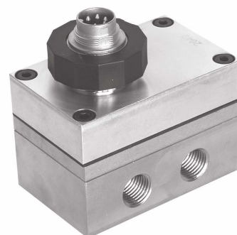
Versione per pressioni medie